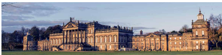
Beindruckende Dimensionen: Wentworth

Nach dem Besuch im Brontë Parsonage Museum in Haworth machen wir auf dem Weg zum Flughafen Halt in Shibden Hall, einem Landsitz, der besonderes Gewicht erhält durch eine schillernde frühere Besitzerin. Flug von Manchester nach Zürich.