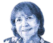
KONZEPT & LEITUNG: Vera Heuberger

Ihre Begeisterung für die Vermittlung von Kunst und Kultur, Architektur und Gartengeschichte, aber auch von Anekdoten, Spleens und angelsächsischer Exzentrik sind für sie Würze und Berufung zugleich. Nach 14 Jahren Leitung von Schloss und Park Oberhofen freut sich die gelehrte Architekturstudienhistorikerin und Anglistin nun darauf, neue Reisen zu kreieren.