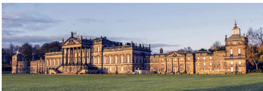
Beeindruckende Dimensionen: Wentworth

Der Morgen erlaubt einen weiteren Einblick in die Besonderheiten von York. Auf dem Weg zum Flughafen werden sich die Reiseeindrücke und die Erinnerungen an die weiten, rauen und faszinierenden Landschaften von Yorkshire nochmals verdichten. Flug von Manchester nach Zürich.