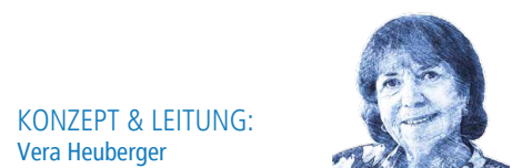
KONZEPT & LEITUNG: Vera Heuberger

Ihre Begeisterung für die Vermittlung von Kunst und Kultur, Architektur und Gartengeschichte, aber auch von Anekdoten, Spleens und angelsächsischer Exzentrik sind für sie Würze und Berufung zugleich. Nach 14 Jahren Leitung von Schloss und Park Oberhofen freut sich die gelernte Architekturstudierende und Anglistin nun darauf, neue Reisen zu kreieren.