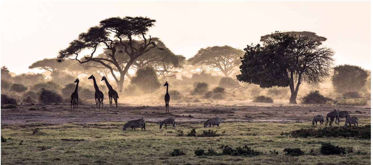
Abendlicht in der Savanne

und Korridore zu anderen Naturschutzgebieten konnte sich hier die grösste Tierwanderung der Welt erhalten. Geschätzt 1.5 - 2 Millionen Gnus, Zebras, Thompson-Gazellen und Topis begeben sich, von der Suche nach Wasser getrieben, auf die «Grosse Migration». Angezogen von den Tiermassen, folgen zahlreiche Löwen und Geparden der Tierwanderung. Die exakte Route lässt sich kaum voraussagen, aber wir haben gute Chancen, auf die wandernden Tierherden zu treffen.