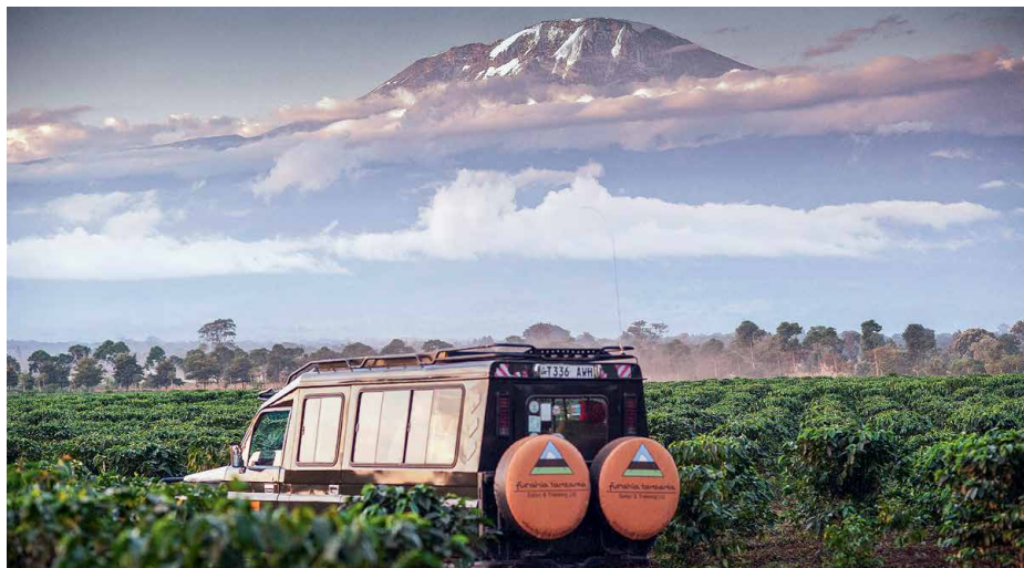
Den ersten Tag verbringen wir am Fusse des Kilimanjaro

Wir lassen uns drei volle Tage Zeit, um die Weiten der Serengeti zu erkunden. Nur durch die riesige Fläche des Nationalparks und die dazugehörigen Pufferzonen