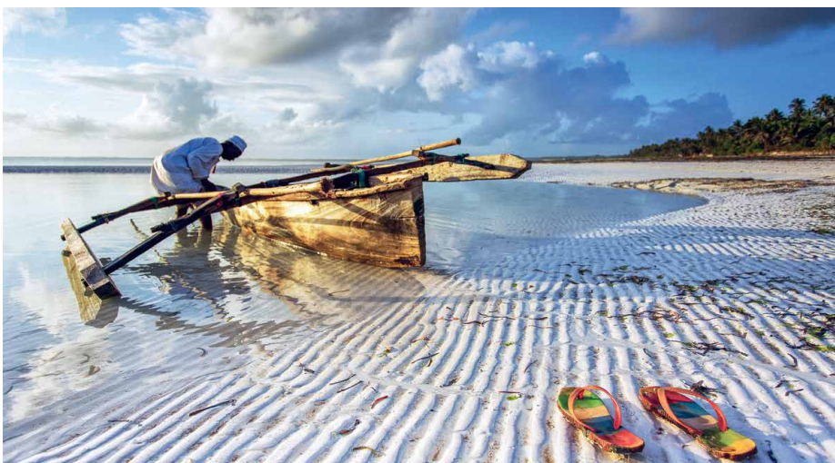
Entspannter Abschluss der Reise auf Sansibar

Im Laufe des Tages fliegen wir zurück in die Schweiz, wo wir am Abend ankommen.