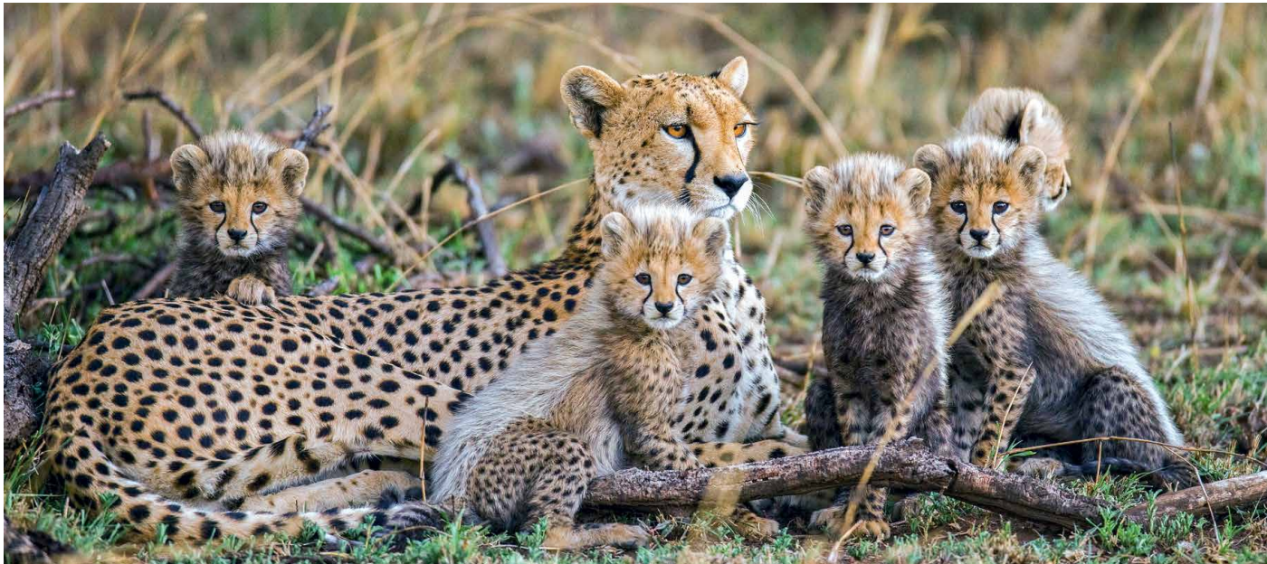
Gepardin mit ihren Jungen

Im Norden Tansanias reihen sich verschiedene Nationalparks aneinander, die Ihnen einen Querschnitt unterschiedlicher Lebensräume für die vielfältige Fauna Ostafrikas vor Augen führen. Wir beginnen unsere Reise am Fusse des Kilimanjaro. Im Tarangire-Nationalpark erwarten uns grosse Elefantenherden und am Ufer des Lake Manyara können wir unzählige Vogelarten beobachten. Die Caldera eines Vulkanes bildet die Grenzen des Ngorongoro-Nationalparks. Schliesslich lassen wir uns drei volle Tage Zeit, um in den Weiten der Serengeti der «Grossen Migration», der grössten Tierwanderung der Welt, zu folgen. Ein entspannender Abschluss der Reise bildet der Aufenthalt auf der Insel Sansibar.