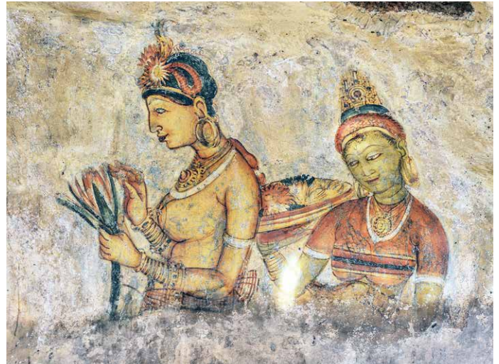
Die Wolkenmädchen von Sigiriya

hat. Das Stadtbild, der Golfplatz, die Pferderennbahn, das Klima, alles fühlt sich «very british» an. Ein wärmender «Afternoon Tea» kommt bei den oft kühlen Temperaturen sehr gelegen. 1 Übernachtung in Nuwara Eliya.