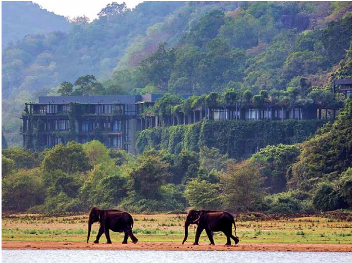
Eine der spektakulärsten Bauten Bawas: Das Hotel Kandalama