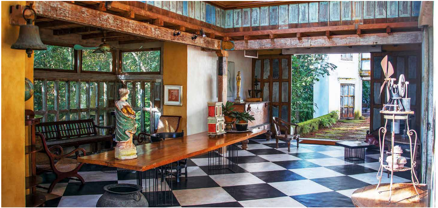
Lunuganga – Bawas Meisterwerk

Auf den Spuren des Architekten Geoffrey Bawa