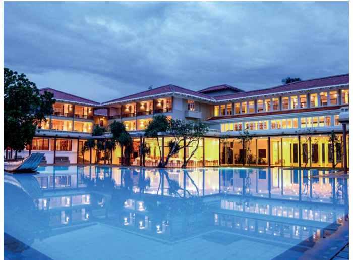
Das Hotel Heritage Ahungalla