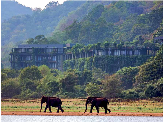
Eine der spektakulärsten Bauten Bawas: Das Hotel Kandalama