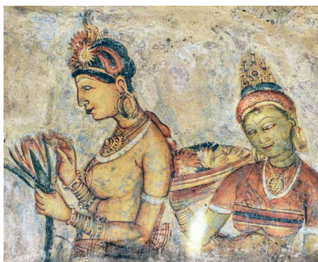
Die Wolkenmädchen von Sigiriya