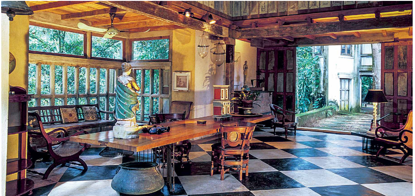
Lunuganga – Bawas Meisterwerk

Die paradiesische Insel Sri Lanka bietet einen grossen Reichtum an antiker, 2300-jähriger Kultur und ein Nebeneinander vier verschiedener Weltreligionen. Naturlandschaften wechseln zwischen Trockengebieten, 2500 m hohen Bergnebelwäldern, sich wie Teppiche über das Hochland ziehenden Teeplantagen sowie tropischem Dschungel, prachtvollen Gärten und kilometerlangen, weissen Sandstränden. Der berühmte Architekt Sri Lankas, Geoffrey Bawa, liess sich architektonisch von der Schönheit der Insel inspirieren. Er gilt als Begründer des tropischen Modernismus. Auf einmalige Art und Weise führte er die Architektur und die üppige tropische Vegetation zusammen. Er verstand es, Natur, Landschaftsformen, natürliche Materialien, Licht und Wasser in die offenen Räume seiner Bauten zu integrieren und sie zu einem Gesamtkunstwerk zu gestalten. Seine Ideen, Philosophien und Bauten begleiten uns auf dieser abwechslungsreichen Reise.