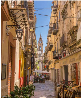
In den Gassen von Palermo