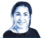
KONZEPT & LEITUNG: Marina Zucca

Am Morgen verabschieden wir uns auf besondere Weise von der Insel. Wir besuchen die Puppenspieler, die in Camilleris Film aufgetreten sind. Am Abend Flug von Catania nach Zürich.