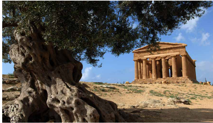
Tempel in Agrigent