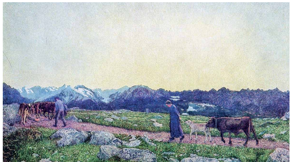
Alpen Triptychon «Sein», G. Segantini

Fahrt über den Julier nach Savognin, wo die junge Familie Segantini mehrere Jahre lebte. Spaziergang durch den Ort mit Blick auf Giovanni Segantinis Perspektiven. Gemeinsames, abschliessendes Mittagessen. Rückfahrt nach Zürich, Ankunft am frühen Abend.