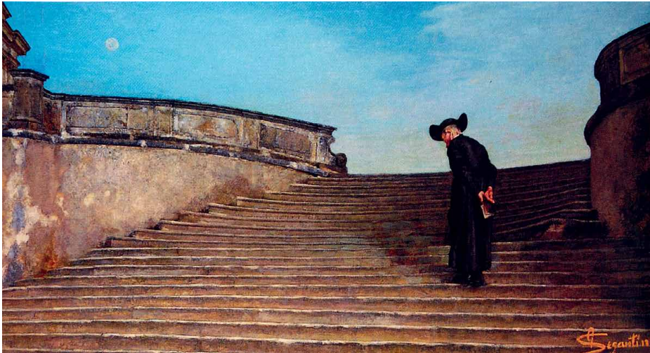
Frühmesse, G. Segantini