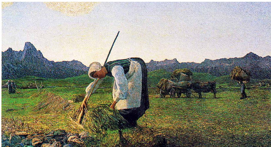
Die Heuernte, G. Segantini