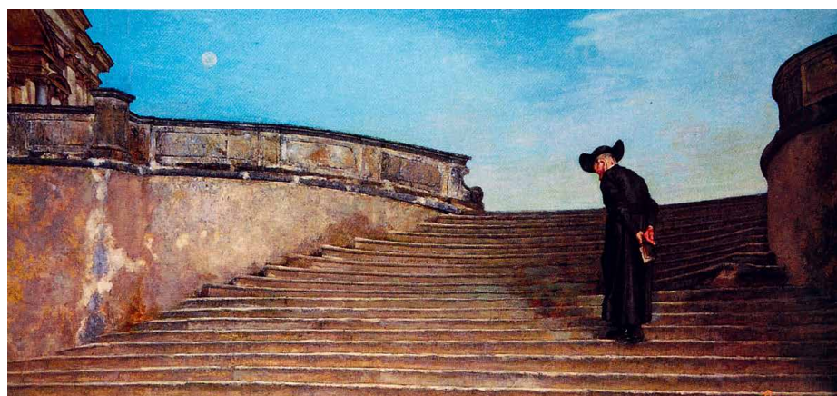
Frühmesse, G. Segantini

Fahrt über den Julier nach Savognin, wo die junge Familie Segantini mehrere Jahre lebte. Spaziergang durch den Ort mit Blick auf Giovanni Segantinis Perspektiven. Gemeinsames, abschliessendes Mittagessen. Rückfahrt nach Zürich, Ankunft am frühen Abend.