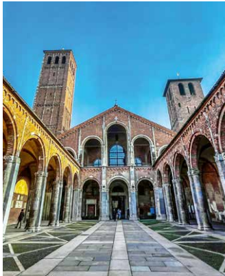
San Ambrogio, Mailand