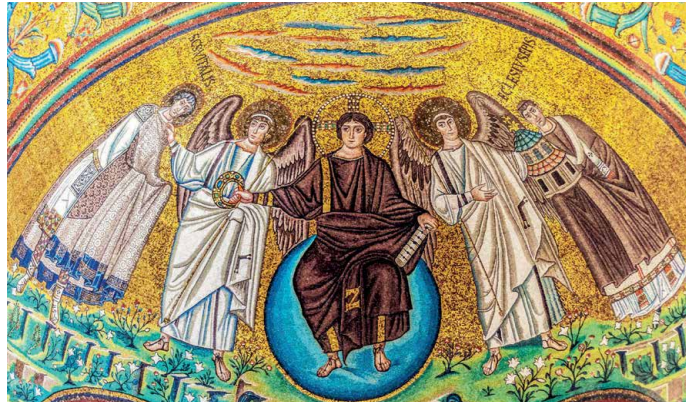
Mosaiken in San Vitale, Ravenna