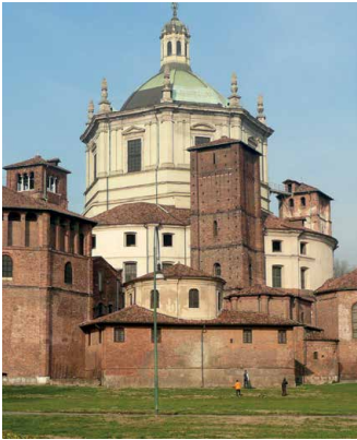
San Lorenzo Maggiore, Mailand