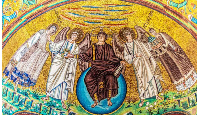
Mosaiken in San Vitale, Ravenna