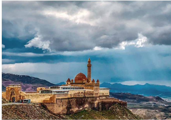
Spektakulär gelegen: Ishak Pasha Palast,