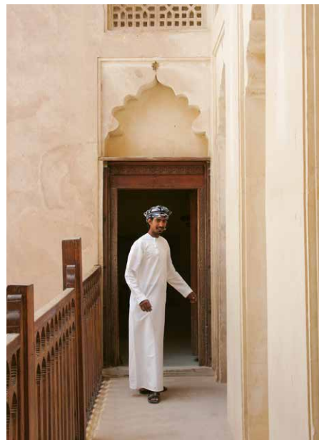
Im Wohnschloss Jabrin