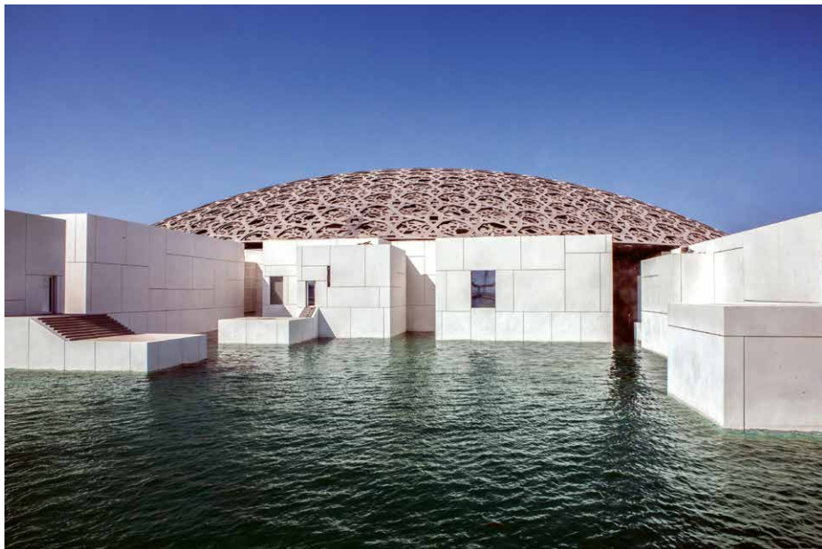
Museum Louvre in Abu Dhabi