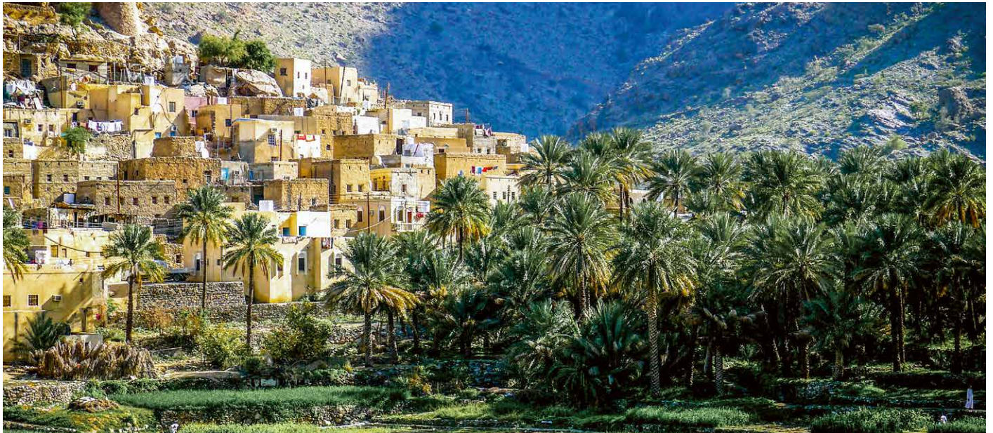
Unterwegs in den Bergen des Oman

Zwischen zerklüfteten Gebirgsketten und endlosen Sandstränden, hochmoderner Infrastruktur und traditioneller Oasenwirtschaft, Wüste und Indischem Ozean – das Land der Gegensätze und eindrucklichen Naturlandschaften bietet einen vielfältigen Einblick in das orientalische Leben. Als Schnittpunkt uralter Handelsstrassen ragen imposante Lehmfestungen in grünen Wadis aus der Wüstenlandschaft hervor. Das Land des Weihrauchs und der Seefahrer lädt zum Eintauchen in geschäftige Souqs und auf sternenklare Nächte in der Wüste ein. Das Sultanat ermöglicht interessante Einblicke in den Spagat zwischen Tradition und Moderne, der durch die weitsichtige Politik des verstorbenen Sultan Qaboos in wenigen Jahrzehnten gelungen ist, ohne den traditionellen Charakter des Landes zu verlieren.