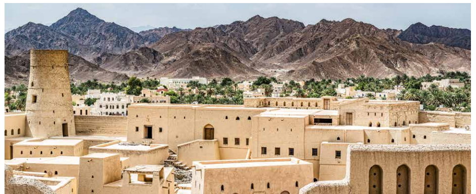
Blick auf Nizwa

Die Region Dakhiliya (Inner-Oman) war traditionell der Lebensraum von Oasenbauern und Nomaden. Nach dem Besuch der eindrucklichen Festung von Nizwa fahren wir nach Bahla, zur grössten Lehmfestung Omans, die von der UNESCO in die Liste des Weltkulturerbes aufgenommen wurde. Vorbei an der malerischen Oase «See der Bananen», Birkat al-Mauz, mit ihrem raffinierten Falaj-Bewässerungssystem, erreichen wir das Schloss Jabrin. Die Ausstattung des Wohnpalastes mit seinen bunten Deckenmalereien und antiken Möbel vermitteln uns einen Eindruck des Hoflebens im 17. Jahrhundert.