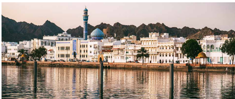
Historische Häuserfront in Muscat

Die beiden Verteidigungsfestungen Mirani und Jalali aus der portugiesischen Zeit des 16. Jahrhunderts prägen bis heute das Altstadtbild Muscats. Zwischen den beiden liess der Sultan seinen Regierungspalast erbauen. Beim Besuch des Nationalmuseums beschäftigen wir uns nochmals mit der Geschichte und Kultur des Landes. Bestimmt bleibt auch noch Zeit für letzte Einkäufe im geschäftigen Souq mit seinem grossen Angebot an Gewürzen, Lederwaren und Textilien. Gegen Abend lassen wir uns auf einer traditionellen Dhow entlang der zerklüfteten Küste treiben und verabschieden uns so vom Oman. In der Nacht Abflug nach Zürich, wo wir am frühen Morgen ankommen.