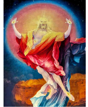
Isenheimer Altar, «Auferstehung»