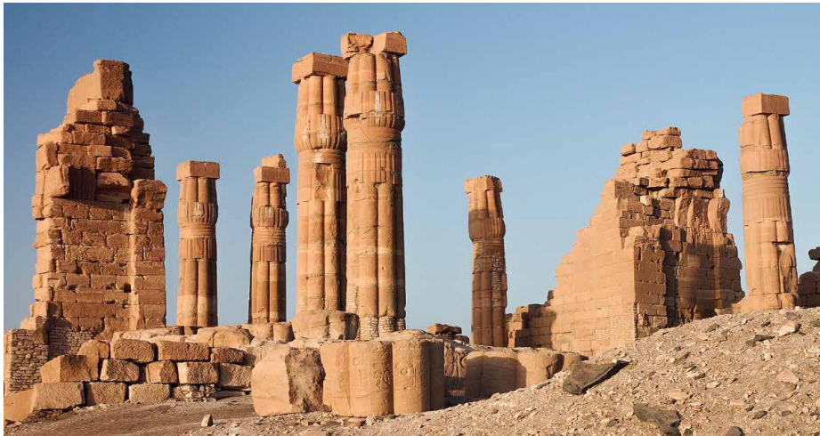
Die Tempel von Soleb

mit fantasievoll bemalten und dekorierten Hauswänden inmitten von Palmen und Sanddünen, wo der Islam nicht so streng ist und die Frauen sich gern mit den Besuchern unterhalten.