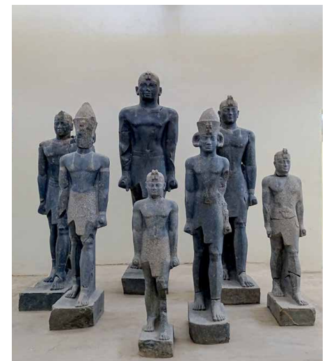
Die Schwarzen Pharaonen

Durch die nubische Wüste mit Sanddünen und roten Steinblöcken gelangen wir nach Alt Dongola, das Zentrum des mittelalterlichen Nubiens am Nilufer. Inmitten der riesigen Altstadt erhebt sich die Thronhalle der christlichen Könige, die später in eine Moschee umgewandelt wurde. Sehenswert sind die Granitsäulen zweier Kirchenruinen. Auf der Weiterfahrt gelangen wir zu wunderschönen Dörfern