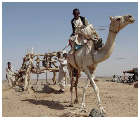
Begegnung an einem Brunnen in der Wüste

Am Morgen überqueren wir mit der öffentlichen Fähre den Nassersee und fahren an die Grenze zum Sudan. Hier führt unsere Weiterreise durch das 200m breite Niemandsland zum sudanesischen Grenzposten. Nach Erledigung der Grenzformalitäten werden wir von unserem sudanesischen Begleitteam in Empfang genommen. Weiterfahrt nach Tombos. 2 Übernachtungen in einem Zeltdorf.