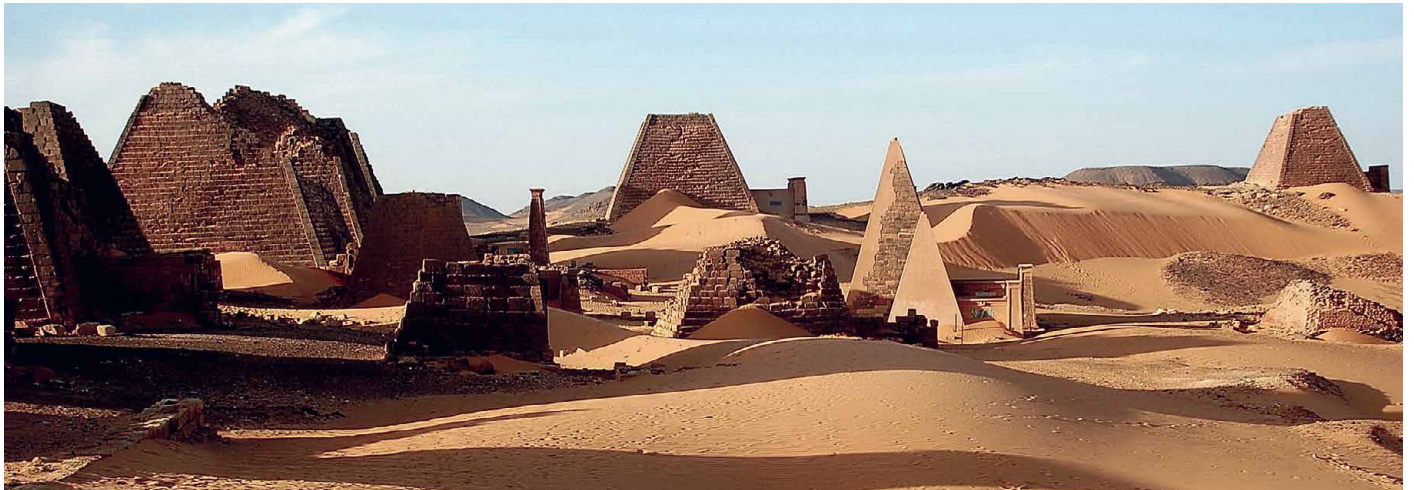
Die Pyramiden von Meroe

Einführung in unsere Reise ist ein Besuch des hervorragenden Nubischen Museums in Assuan. Es folgt Abu Simbel mit seiner kolossalen Statuenfassade Ramses II. Im Sudan; kaum ein Besucher weit und breit, einsam und leicht vom Sand überdeckt, erheben sich Hunderte von Pyramiden in der Wüste. Hier erleben wir den archäologischen Reichtum dieses wundervollen Landes beinahe so, wie einst die Archäologen vor 200 Jahren. Unsere Route führt zu gepflegten Dörfern und archäologischen Höhepunkten wie den Pyramiden von Meroe (UNESCO-Welterbe), dem reliefgeschmückten Löwentempel von Naga, dem gewaltigen Ruinenfeld von Al-Musawwarat es-Sufra sowie dem mächtigen Tempel beim heiligen Barkal-Berg. Das Museum in Khartum gewährt uns mit kaum bekannten Schätzen einen eindrücklichen Überblick über die Jahrhunderte dauernde Kultur Nubiens.