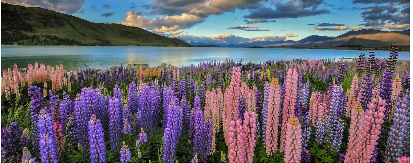
Blühende Lupinen erwarten uns am Lake Tekapo

Einmal im Leben ans andere Ende der Welt! Unsere umfassende Reise führt durch die schönsten Landschaften und Städte Neuseelands. Ein Schwerpunkt unserer Reise ist die Kultur der Maoris. Ein Maori-Reiseleiter führt uns durch Auckland, wir sind bei einem traditionellen Essen zu Gast und entdecken die Kunstschatze der Maoris im Nationalmuseum bei einer Führung durch das Depot, wo 80 % der Sammlung eingelagert sind.