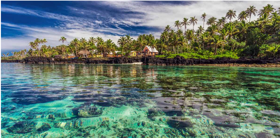
Polynesien pur auf Samoa