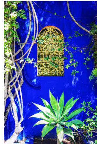
Jardin Majorelle, Marrakesch

In den Königsstädten Marokkos spiegelt sich die kulturelle Vielfalt des Landes wider. Das heutige Stadtbild von Fès, bekannt durch die grösste erhaltene Altstadt der Welt, wurde durch die Meriniden geprägt. Meknes und Rabat, die heutige Hauptstadt und Residenz des Königs, dienten den Alawiden als Hauptstädte. Marrakesch, am Fusse des Hohen Atlas, wurde von den Almoraviden gegründet und war auch das Zentrum der Almohaden und Saadier. Diese Herrscherdynastien hinterliessen ein reiches Erbe an prächtigen Bauten, was jeder der Städte einen eigenen, unverkennbaren Charakter verleiht.