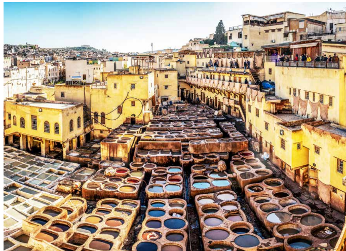
Die Gerbereien von Fès