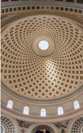
Dom der Kirche in Mosta

Von megalithischen Tempelbauern bis zu den Malteserrittern