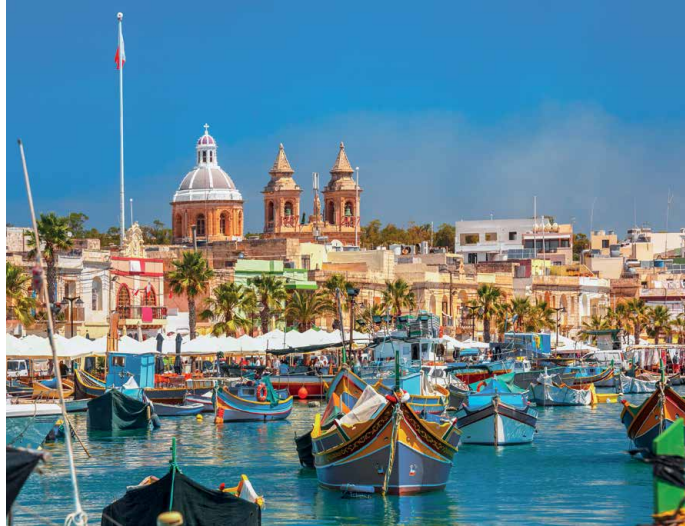
Mediterran - der Hafen von Marsaxlokk