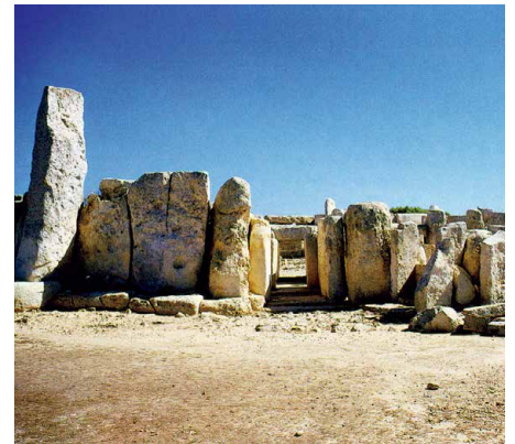
Hagar Qim, Tempelbau vor 4700 Jahren