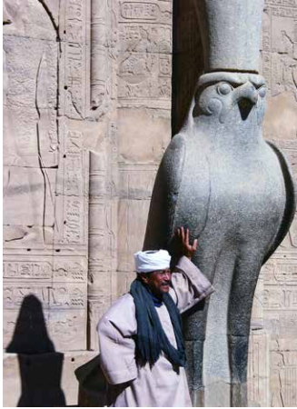
Im Horus-Tempel von Edfu