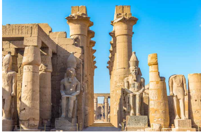
Innenhof des Luxor-Tempels