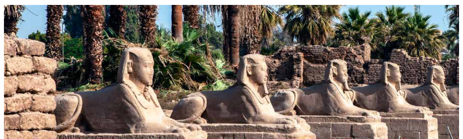
Die Sphingen-Allee beim Karnak-Tempel

Vor dem Rückflug bleibt Zeit für letzte Einkäufe oder Erkundungen in Eigenregie. Vielleicht unternehmen Sie eine Fellucca-Fahrt auf dem Nil, einen Kamelritt am Wüstenrand oder besuchen nochmals eine der Tempelanlagen. Am Nachmittag Fahrt zum Flughafen und Heimflug.