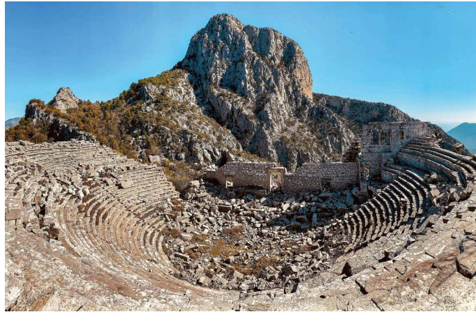
Theater von Termessos