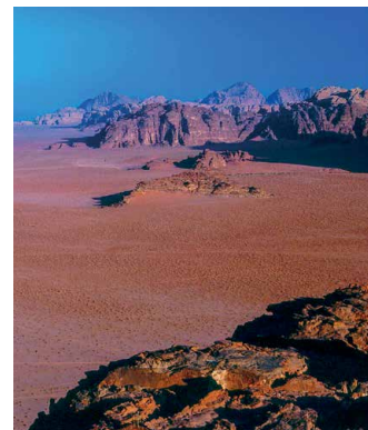
Spektakulär: Wadi Rum

Das 1946 gegründete haschemitische Königreich Jordanien vereint auf relativ kleiner Fläche den Zauber der grünen Hügel, Flüsse und Seen des «Heiligen Landes», trockene Wadis, die lockende Weite flacher Steppe, einsamer Felsendome und Sandwüste mit einem beispiellosen Reichtum historischer Relikte. Die meisten von diesen gehören der Blüte- und Spätzeit des Oriens Romanus an, auf dessen Boden sich Spuren einer faszinierenden Vermischung jüdisch-hellenistisch-römischer, byzantinisch-christlicher und vor- und frühislamisch syro-arabischer Kulturen studieren lassen. Hier trafen Orient und Okzident in friedlicher Symbiose und unerbittlichen Kämpfen aufeinander.