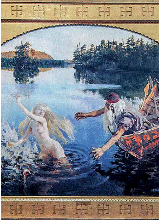
Ausschnitt aus dem «Aino-Mythos»