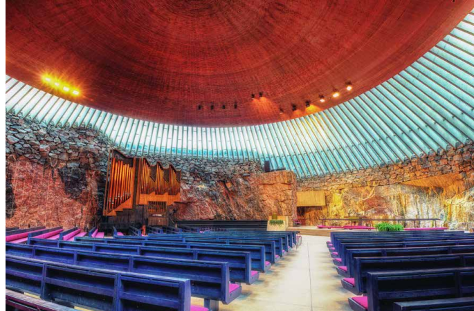
In den Fels gehauen: die Tempeliaukio-Kirche