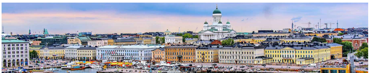
Aussicht auf Helsinki – die «Weisse Stadt des Nordens»