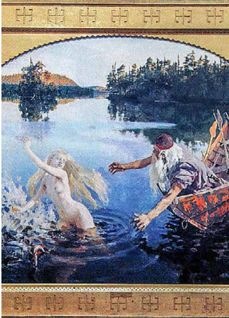
Ausschnitt aus dem «Aino-Mythos»