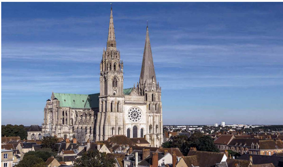
Der Gotik-Bau dominiert das Städtchen