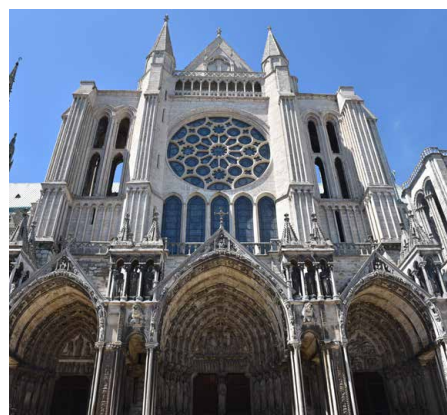
Portale der Westfassade