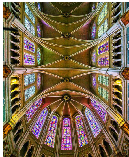
Auch im Innern beeindruckt die Kathedrale

Was für ein Glücksfall, dass die Kirche von Chartres nie zerstört worden ist! In keiner andern Kathedrale können wir die Atmosphäre der Hochgotik so intensiv und unverfälscht erleben. Wir nähern uns diesem Bauwerk aus kunsthistorischer und theologischer Sicht und beschäftigen uns vor allem mit dem reichen Skulpturenprogramm der drei Fassaden sowie auch mit ausgewählten Glasmalereien.