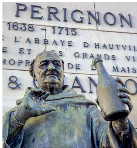
Dom Pérignon, Erfinder des Champagners

Unsere Rückfahrt in die Schweiz führt uns erst ins Elsass, wo wir in Riquewirth zum Abschiedessen erwartet werden. Nach einem Spaziergang durch das idyllische Dorf fahren wir weiter nach Zürich, wo wir am frühen Abend ankommen.