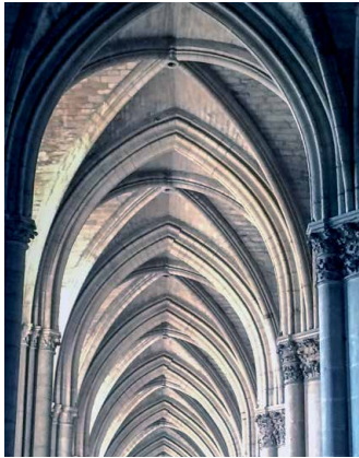
In der Kathedrale von Reims