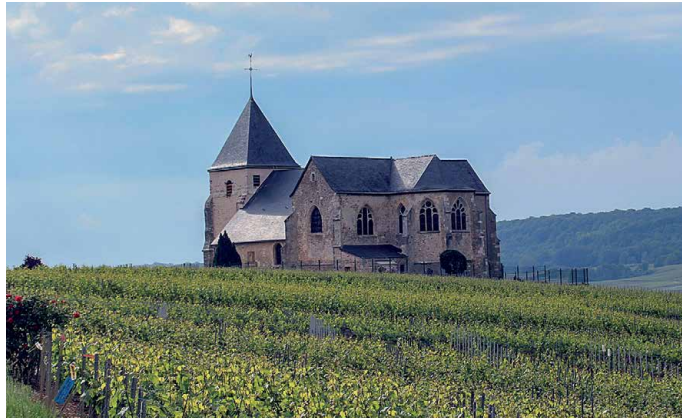
Kirche von Chavot liegt inmitten der Rebberge