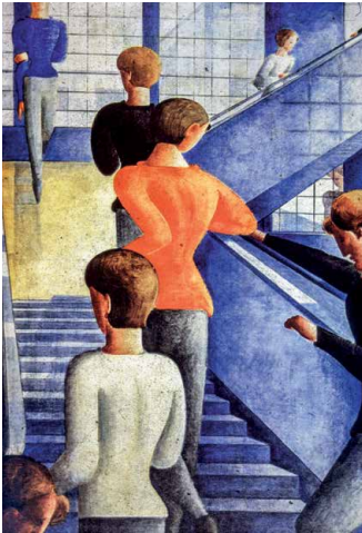
Oskar Schlemmer «Die Bauhaustreppe»