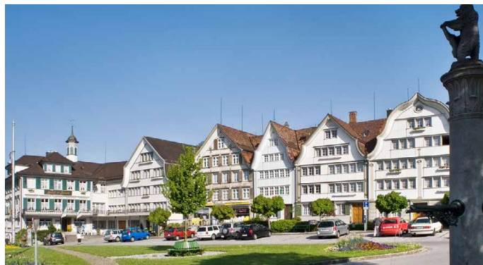
Dorfplatz von Gais