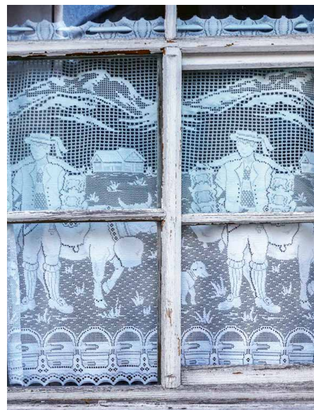
Fenster in Schwellbrunn - dem schönsten Dorf der Schweiz