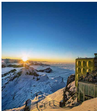
Sonnenuntergang am Säntis