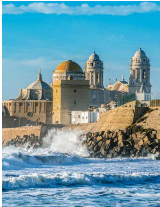
Kathedrale von Cádiz