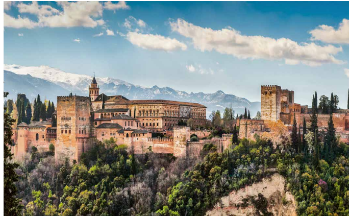
Blick auf die Alhambra