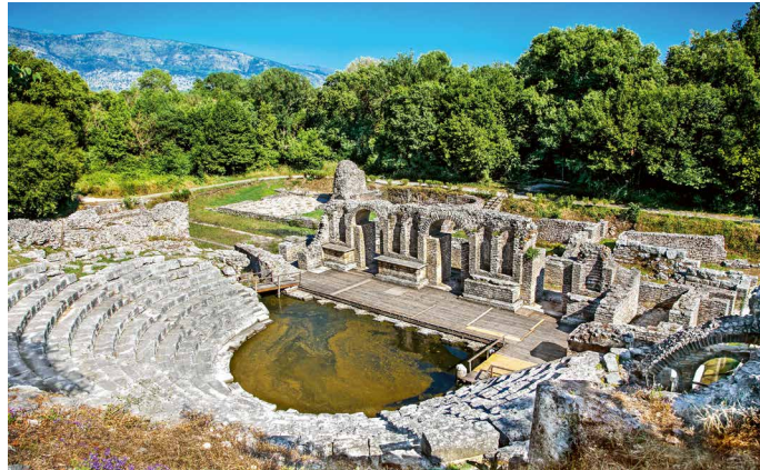
Amphitheater in Butrint