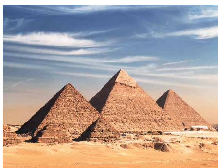
Die Pyramiden von Giza

Wir besuchen den versetzten Isistempel von Philae auf der Insel Agilkia. Vom Hochdamm aus haben wir einen Blick auf den riesigen Nasser-Stausee, bevor wir in einem Steinbruch südlich des Nils einen nicht fertiggestellten Obelisken aus Rosengranit besichtigen. Abends beziehen wir die Kabinen auf unserem komfortablen Schiff, der «MS Prince Abbas», auf der wir viermal übernachten.