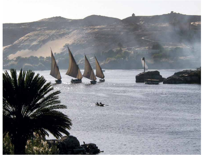
Der Nil bei Assuan

Komplex von Medinat Habu. Die Aussenreliefs mit der berühmten Seevölkerschlacht sind am besten im frühen Morgenlicht zu erkennen. Im Tal der Königinnen besuchen wir anschliessend Prinzengräber. In der Siedlung der Nekropolenarbeiter, Deir el-Medina, sind neben der Siedlung selbst und einem kleinen ptolemäischen Tempel vor allem die Gräber hoher Beamter besonders sehenswert. Die Fresken der sogenannten Privatgräber lassen Leben und Jenseitsvorstellungen im alten Ägypten lebendig werden.