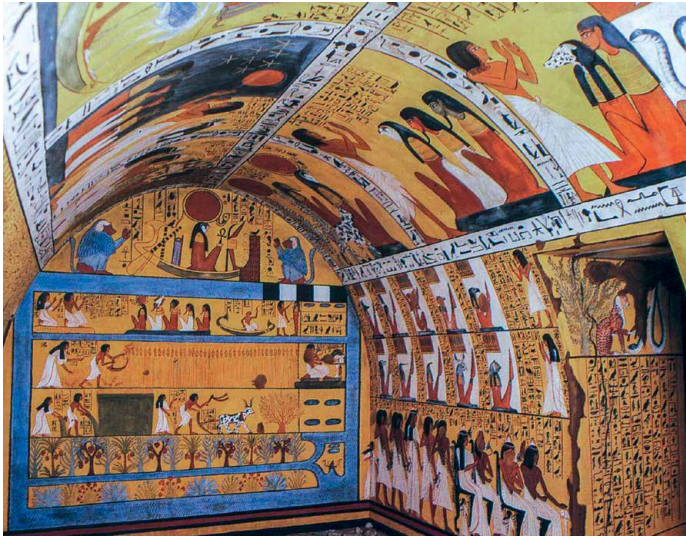
Grab des Senedjem, Deir el Medina