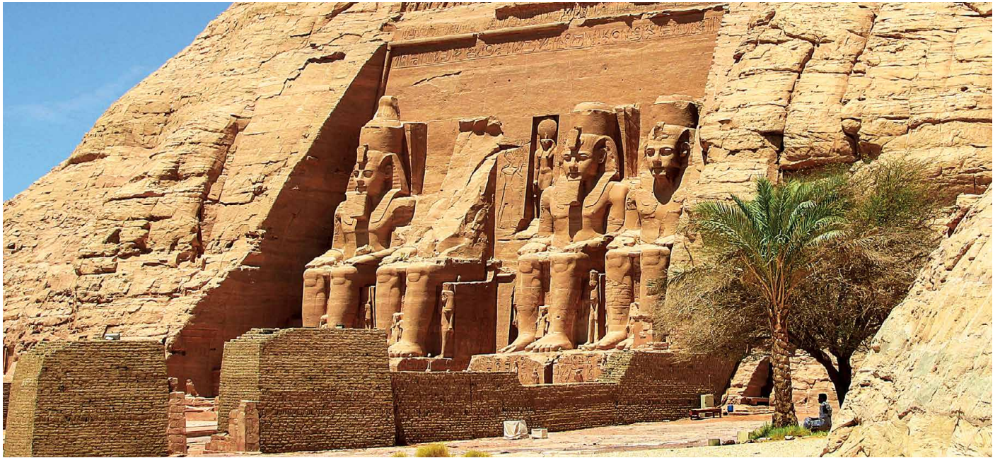
Unser Ziel – die eindrückliche Tempelanlage von Abu Simbel

Mit Kreuzfahrt auf dem Nasser-Stausee nach Abu Simbel