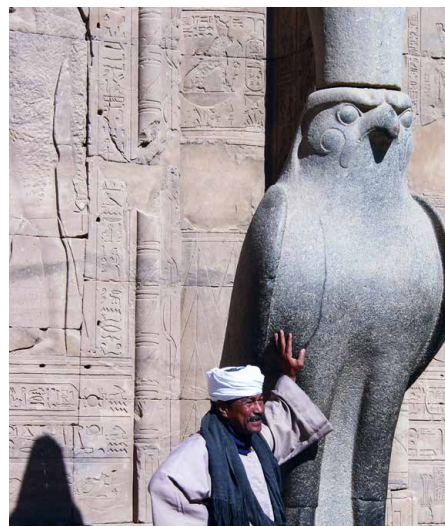
Im Horus-Tempel von Edfu

Den Morgen verbringen wir auf den Spuren der Kopten. Im Koptischen Museum erhalten wir erste Informationen zum Christentum in Ägypten. Danach besuchen wir El Moalacka, die «Hängende Kirche» mit ihrer Ikonostase aus Ebenholz und die Kirche St. Sergius, sowie die Synagoge. Der Nachmittag ist einem ersten Besuch im Nationalmuseum gewidmet, dem weltweit grössten Museum für altägyptische Kunst. Die Fülle an Exponaten ist überwältigend, so dass wir nur ausgesuchte Ausstellungsstücke besichtigen und uns bei einem zweiten Besuch weiter in die einmalige Sammlung vertiefen.