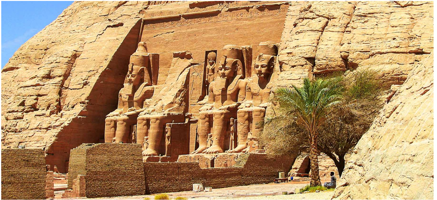
Unser Ziel - die eindrückliche Tempelanlage von Abu Simbel

Mit Kreuzfahrt auf dem Nasser-Stausee nach Abu Simbel