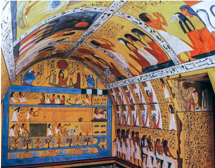
Grab des Senedjem, Deir el Medina