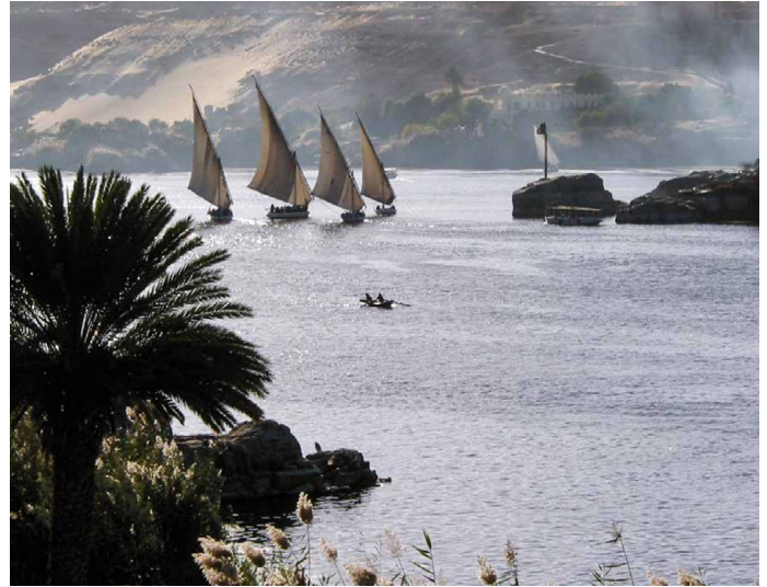
Der Nil bei Assuan

Mal auf die thebanische Westseite. Nach einem Halt bei den Memnonskolossen mit dem Totentempel von Amenophis III., widmen wir uns dem riesigen Komplex von Medinat Habu. Die Aussenreliefs mit der berühmten Seevölkerschlacht sind am besten im frühen Morgenlicht zu erkennen. Im Tal der Königinnen besuchen wir anschliessend Prinzengräber. In der Siedlung der Nekropolenarbeiter, Deir el-Medina, sind neben der Siedlung selbst und einem kleinen ptolemäischen Tempel vor allem die Gräber hoher Beamter besonders sehenswert. Die Fresken der sogenannten Privatgräber lassen Leben und Jenseitsvorstellungen im alten Ägypten lebendig werden.