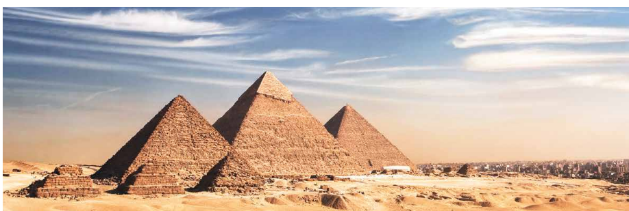
Die Pyramiden von Giza