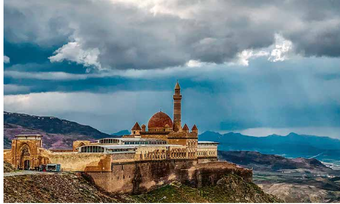
Spektakulär gelegen: Ishak Pasha Palast