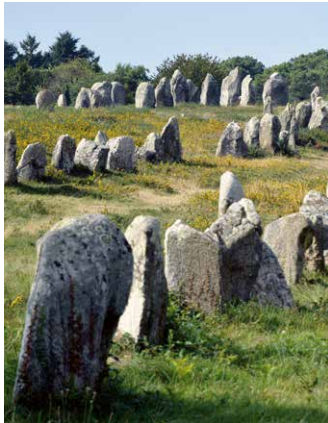
Die Menhire in Carnac