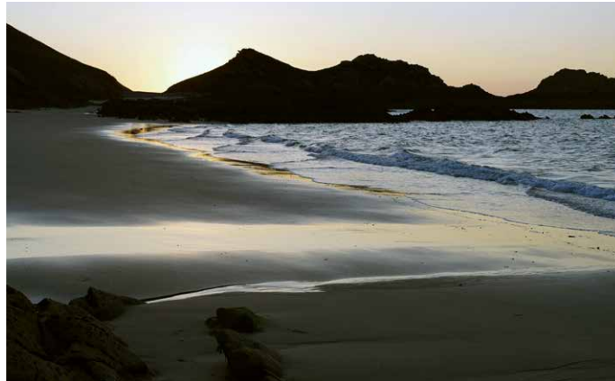
Mit etwas Glück erleben wir auch das «Meeresleuchten»