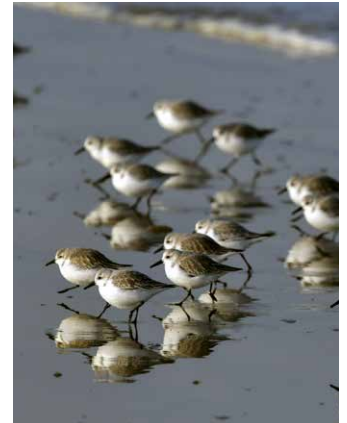
Sanderlinge im Watt

Die Nordküste der Bretagne ist geprägt von starken Gezeiten, die sich hier bis zu zwölf Meter hoch auftürmen. Dies hat Konsequenzen für Fauna und Flora, genauso aber auch für die Menschen. Die enormen Tiden legen die Strände zweimal täglich trocken und bringen die Vielfalt des Meereslebens auf dramatische Weise zum Vorschein. Zwischen den Tiden erscheinen bizarre Lebewesen auf dem Präsentierteller des freigelegten Meeresbodens. Die Landschaften der Bretagne sind abwechslungsreich und voller Dramatik. Wir reisen auf hohe Klippen, in Salzwiesen, Algenwälder und zu weiten Sandstränden. Der Meeresbiologe Thomas Jermann wird Sie in die Biologie der Gezeitenzone einführen und auf Spaziergänge auf den Meeresgrund und in die typischen bretonischen Lebensräume mitnehmen. Die steinzeitlichen Monumente von Carnac gehören mit mehr als dreitausend Menhiren, dem grössten Tumulus (Grabhügel) Kontinentaleuropas und mehreren Dolmengräbern zu den eindrucklichsten historischen megalithischen Zeugnissen.