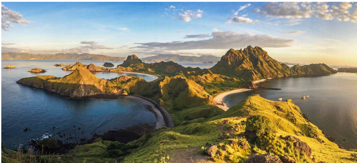
Die Inselwelt des Komodo-Archipels