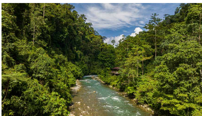
Landschaft im Gunung-Leuser-Regenwald