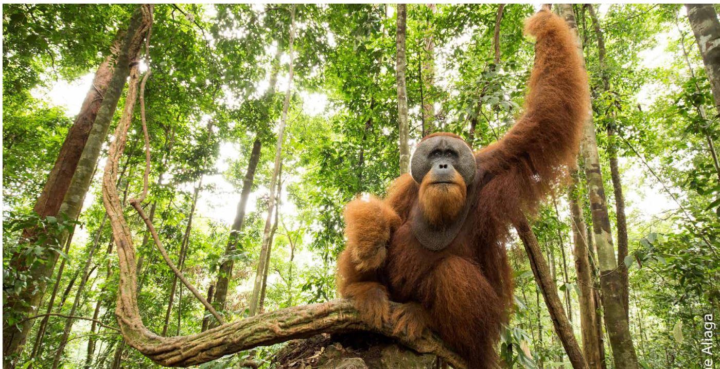
Orang-Utan im Gunung-Leuser Nationalpark