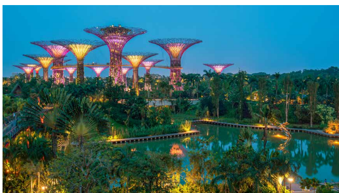
Gardens by the Bay in Singapur

Gardens by the Bay ist ein 100 Hektar großes Parkgelände, das auf künstlich aufgeschüttetem Land östlich der Marina Bay angelegt wurde. Der Park ist einer der grössten botanischen Gärten in Asien. Er zeigt eine grosse Pflanzenvielfalt im Flower Dome, im Cloud Forest und auf den bis 50 m hohen, künstlichen Bäumen. Um Mitternacht Rückflug in die Schweiz, wo wir am nächsten Morgen landen.