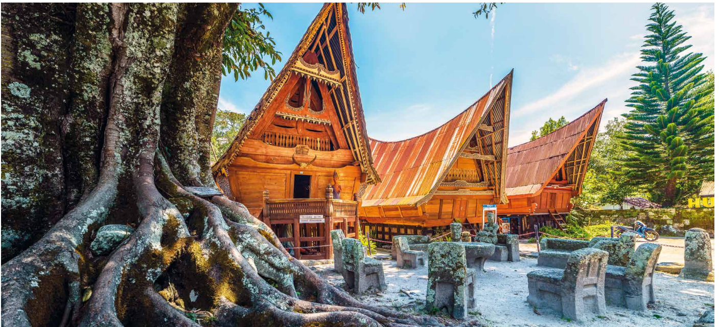
Batak-Häuser auf der Insel Samosir

Schwesterstiftung YEL bietet all jenen Orang-Utans eine Heimat, die nicht mehr ausgewildert werden können. Gleichzeitig entsteht mit dem Orang-Utan Haven ein grosses Umweltbildungszentrum, wo Schulklassen und Touristen auf Ecotrails, im Ecofarming Centre und in der Ausstellung des Bambus-Besucherzentrums das Ökosystem Regenwald erleben können und für dessen Schutz sensibilisiert werden. 1 Übernachtung in Berastagi