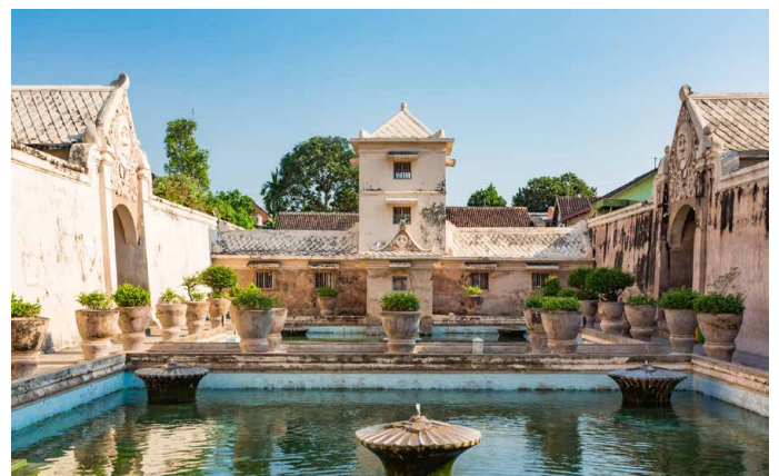
Sultanspalast in Yogyakarta