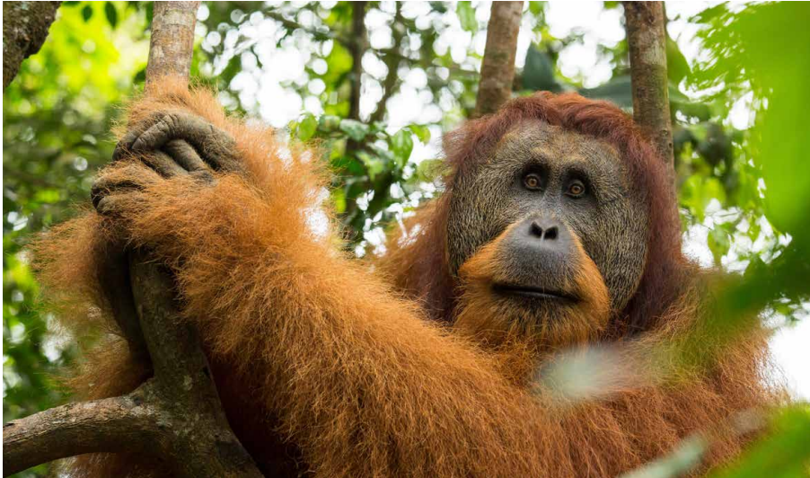
Begegnung im Gunung-Leuser Nationalpark