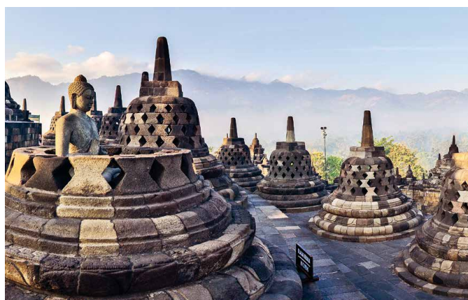
Buddhistischer Tempel Borobudur

Nur auf dem Komodo-Archipel leben derzeit noch etwa 5000 Komodowarane, von den Einheimischen Drachen genannt. Heute beginnt die Inselfahrt auf einem lokalen Holzboot mit klimatisierten Kabinen sowie Gemeinschaftsbad mit landestypischen „Mandi“ (Schöpfbad), inkl. Vollpension. Auf der Insel Rinca folgen wir unter Füh-