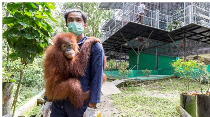
Tierpfleger im «Orang-Utan Haven»