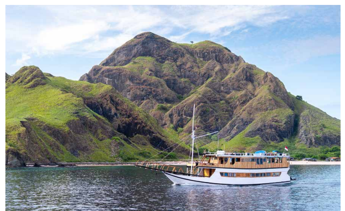
Bootsfahrt mit zwei Übernachtungen im Komodo Nationalpark

Auf der Insel Kanawa lohnt sich das Schnorcheln besonders. Kristallklares Wasser bietet eine gute Sicht auf die Unterwasserwelt. Auf der Bootsfahrt nach Labuan Bajo genießen wir ein leckeres Mittagessen. 1 Übernachtung in Labuan Bajo.